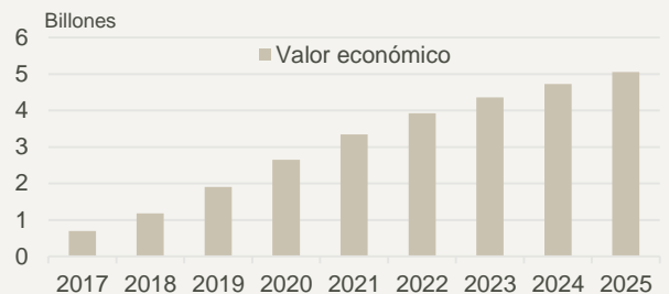
El crecimiento secular de la IA

De acuerdo con Gartner, se estima que la inteligencia artificial crecerá a un ritmo anual del 23% entre 2018 y 2025 (de 1.180 billones a 5.050 billones de dólares), mientras que la tecnología global lo hará un 10%. Esos billones demuestran la magnitud del impacto de esas nuevas tecnologías en la economía.