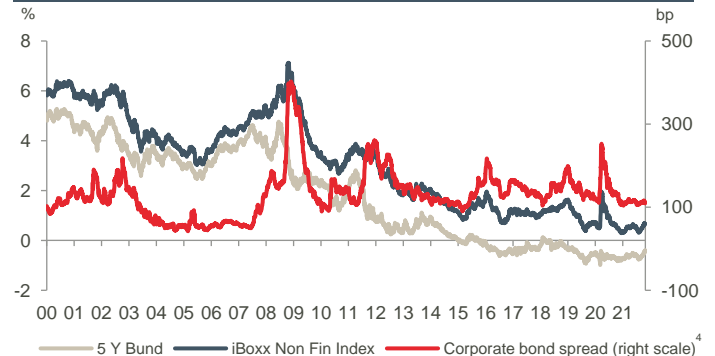
Renditeniveaus: Staatsanleihen ggü. Unternehmensanleihen