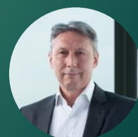
NICOLAS CHAPUT Global CEO

L'industrie de la gestion d'actifs participe de manière active à la transition de nos sociétés vers un modèle de fonctionnement plus durable. Notre objectif est de soutenir la transition écologique en sélectionnant des entreprises qui bénéficient de la transformation économique mondiale.